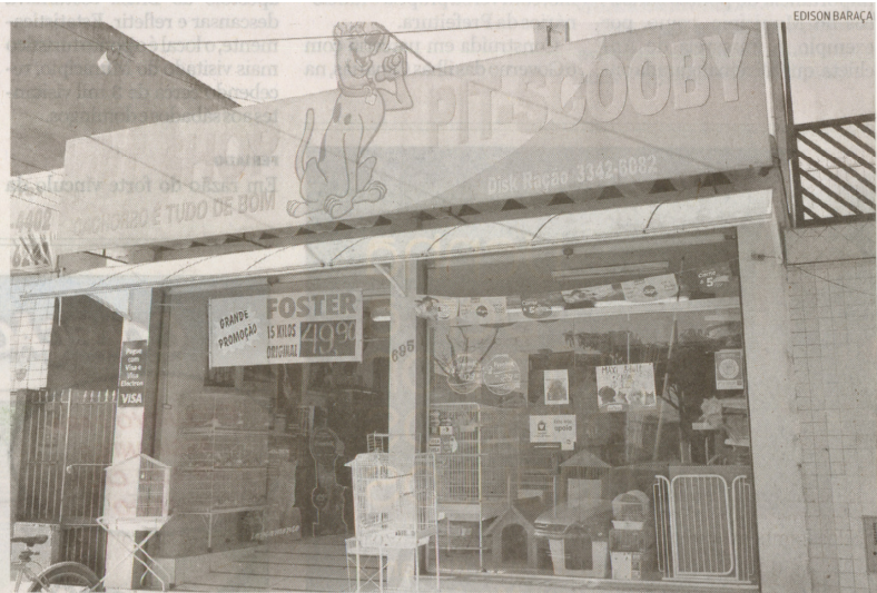
O assalto ocorreu no Pet Shop Pit Scooby da Avenida Santos Dumont, em Vicente de Carvalho

Os acusados, no entanto, dispararam em sua direção,