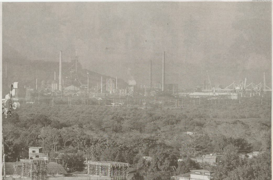
As desapropriações de grandes áreas, como no caso da extinta Vila Paris, em Cubatão, têm emperrado os orçamentos das prefeituras da região

Prefeituras da Baixada Santista serão beneficiadas caso a proposta se torne uma súmula vinculante, ou seja, decisão que serviria de base para quaisquer processos do tipo. Apenas em Guarujá, Cubatão e Santos, três cidades com alto estoque de precatórios, deixariam de incidir juros sobre um montante próximo a R$ 800 milhões — o equivalente a um ano do orçamento cubatense. Respectivamente, os débitos aproximados são de R$ 465 milhões (Guarujá), R$ 174 milhões (Santos) e de até R$ 160 milhões (Cubatão).